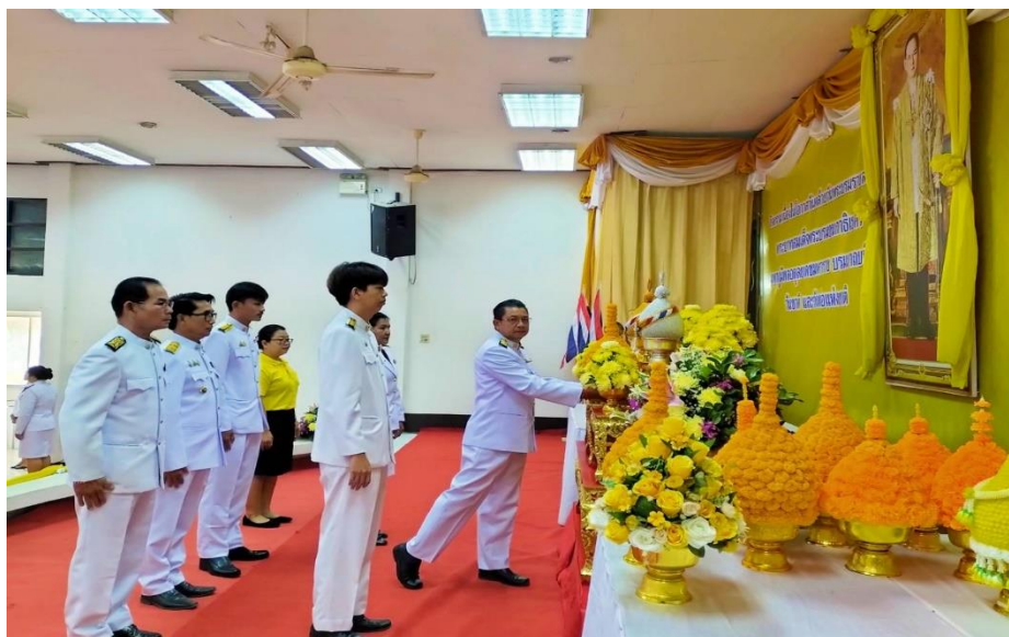
ร่วมพิธีถวายพานพุ่มดอกไม้ เพื่อน้อมรำลึก ในพระมหากรุณาธิคุณของพระบาทสมเด็จพระบรมชนกาธิเบศรมหาภูมิพลอดุลยเดชมหาราช บรมนาถบพิตร ในวันที่ ๕ ธันวาคม ๒๕๖๖