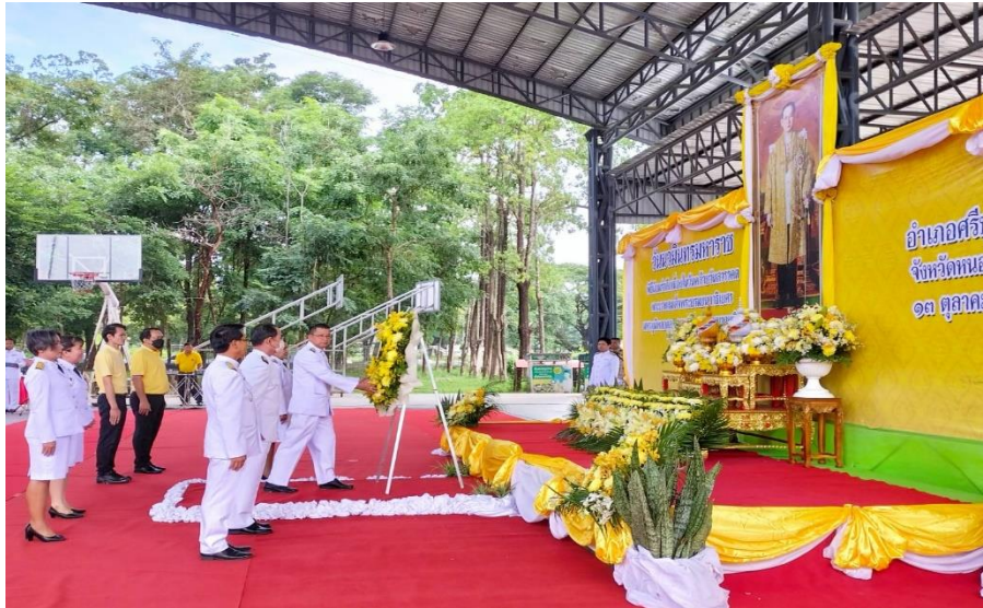
ร่วมพิธีวางพวงมาลา เนื่องในวันนวมินทรมหาราช เพื่อน้อมรำลึกในพระมหากรุณาธิคุณของพระบาทสมเด็จพระบรมชนกาธิเบศรมหาภูมิพลอดุลยเดชมหาราช บรมนาถบพิตร ในวันที่ ๑๓ ตุลาคม ๒๕๖๖